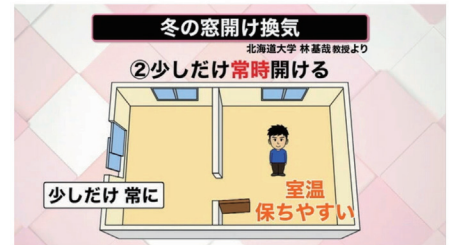
「少しだけ常時換気」の方が室温を保ちやすい

気温が下がっていく冬ですので夏の頃のように 入口を蚊帳で空けるといっても行かないのですが 窓を常時開けたりして室内の換気に努めます。 また、ブース内は24時間換気扇をまわして 換気します。ABブースより狭いCブースですが 実はこの部屋はビルの施設の「ロスナイ換気」を中に 移設しており、さらに新鮮な空気の入替えができています。 またレッスンのない時間はこれまで通りにドアを 開放してサーキュレーターで空気を循環させます。