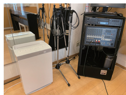
空気清浄機は各レッスンブースに