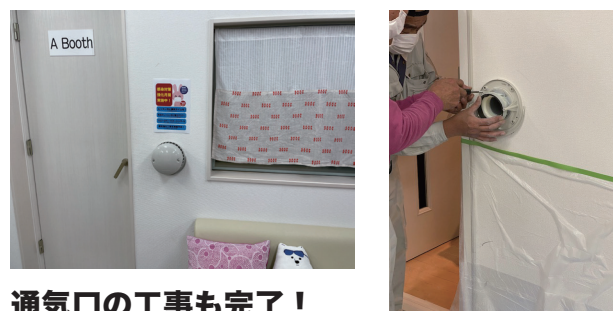
通気口の工事も完了！

医療現場の手術器材などの殺菌に使用するために導入され ているウイルスが99.9%除菌できる装置を購入しました。 ヨーロッパで主に導入されており、日本でも医療現場や 今、国立劇場、レコード会社のスタジオ、カラオケBOX から歯医者まで導入されてきています。空気中だけでなく 壁やマイクなどまで除菌できる装置になります（要は、太陽の 光でお布団を干す。部屋事態を布団干しするイメージ）これで さらに除菌を定期的実施します。※紫外線ですので照射して いる間はブースに入室ができませんので、ご注意ください （照射後は干した後のお布団のような匂いがあります）