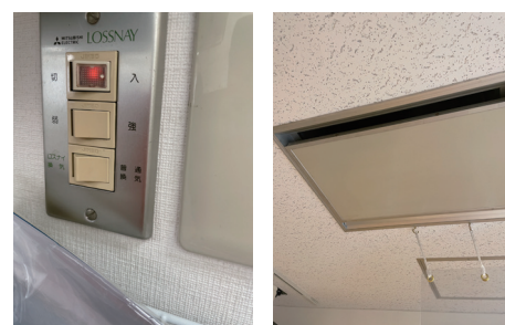
Cブースのロスナイ換気